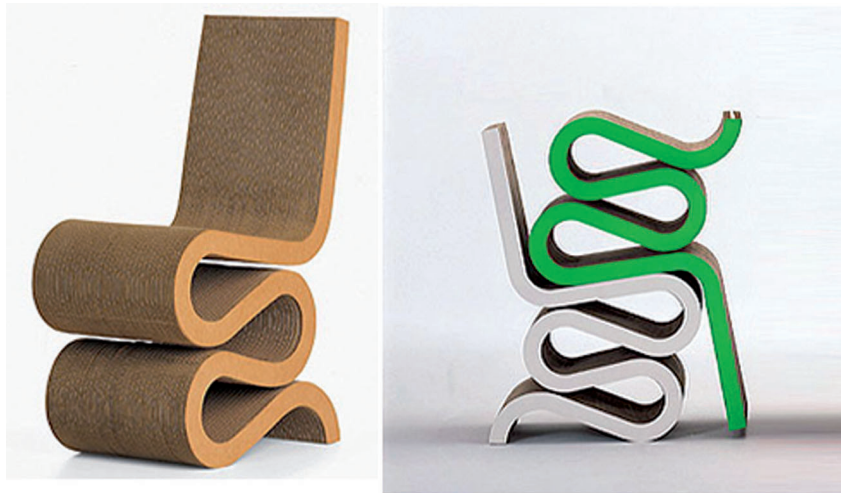
Figure 3: la chaise Wiggle Side