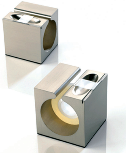
Figure 5 : le dérouleur de ruban adhésif Spence

[Source : Umbra (www.umbra.com). Design de Adin Mumma. Utilisé avec permission]