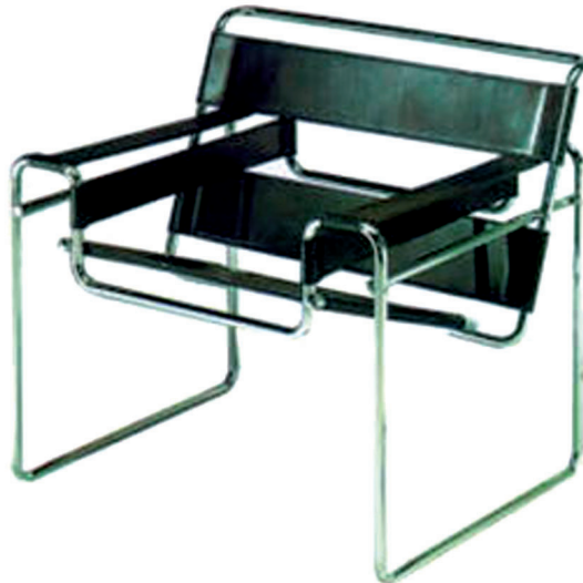
Figure 2 : chaise métallique tubulaire de Mart Stam