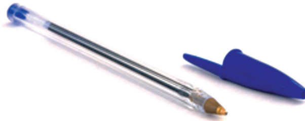
Figure 4 : le stylo Bic Cristal